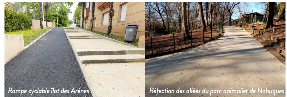
Rampe cyclable ilot des Arènes