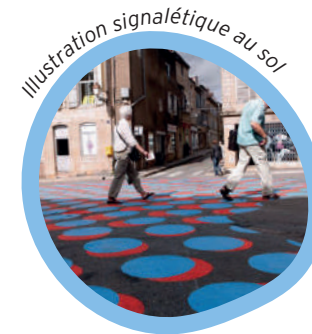
Illustration signalétique au sol