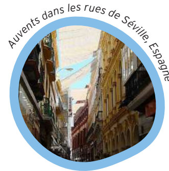
Auvents dans les rues de Séville, Espagne