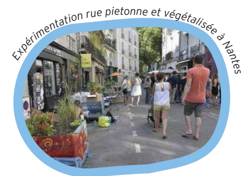
Expérimentation rue piétonne et végétalisée à Nantes