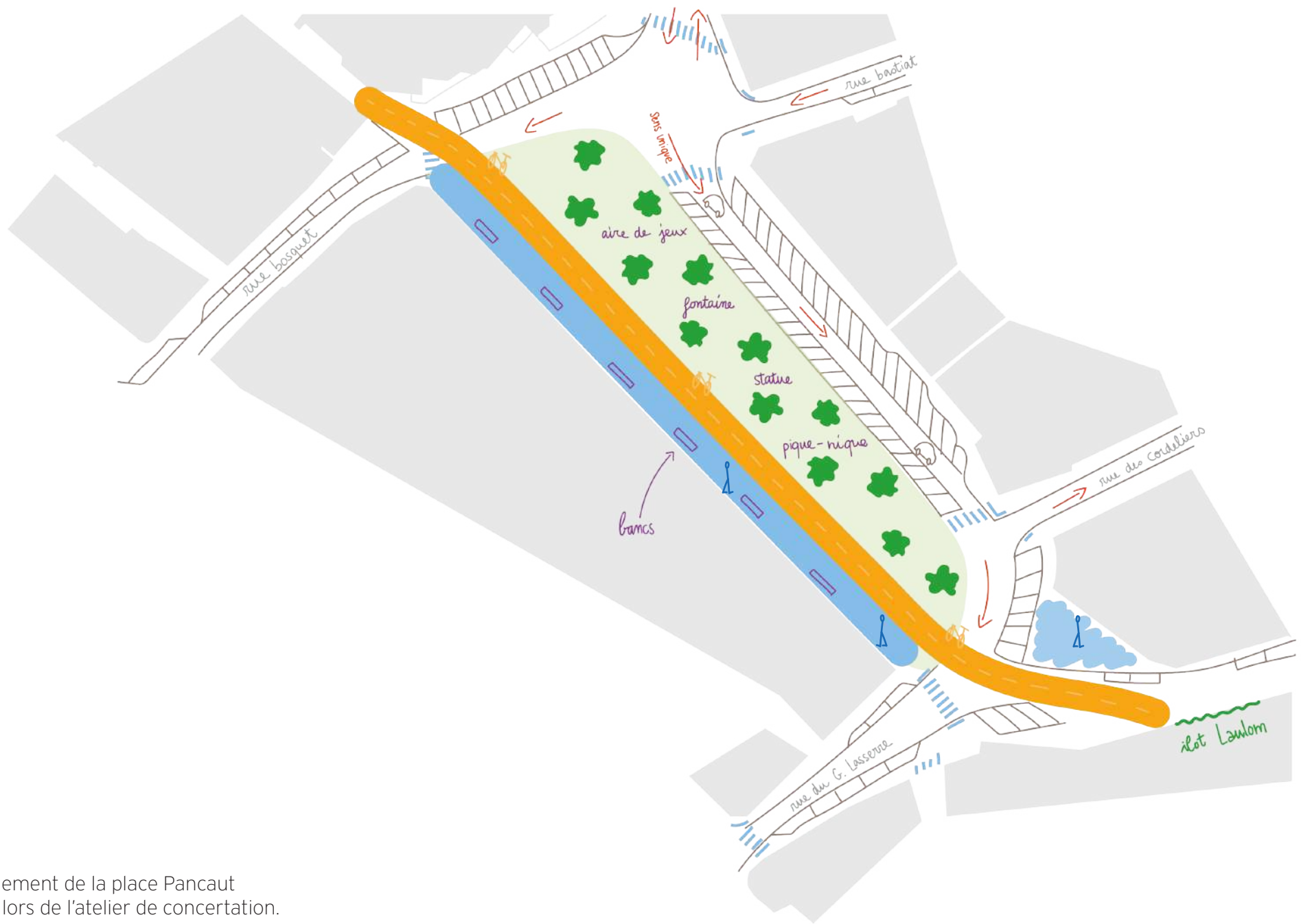
Aménagement de la place Pancaut imaginé lors de l'atelier de concertation.