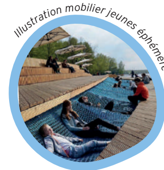
Illustration mobilier jeunes éphémère