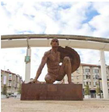
Le Veilleur Monumental Thésée et l'Amazone, du Torse au Belvédère, Bonnelles

faire un guerrier accroupi dans une attitude mêlant la vigilance au défi, dans une attente sereine, magnifique et grave, sorte de double négatif d'une Aphrodite au bain. Haute de près de 2 mètres, cette masse de chair à la fois imposante et puissante exprime le calme inébranlable du héros, figure incontournable encore une fois du mythe, mais d'un mythe inexorablement contemporain par le traitement du regard. Un regard tout à la fois empreint d'une solide détermination, d'une maîtrise de soi absolue et d'une beauté inspirée des héros de science-fiction forgés par les romans d'anticipation et les revues d'illustrations du XX e siècle. Cette description vaut également pour la Tête de Persée monumentale où le sculpteur réussit à transfigurer, par la puissance plastique de son geste, la sérénité vaine du héros. Fragment imaginaire d'une statue colossale, réduit à un visage monumental impressionnant, le héros Persée, figure majeure dans l'œuvre de Christophe Charbonnel, interroge et intimide, frappe par sa détermination et sa beauté venue d'un temps