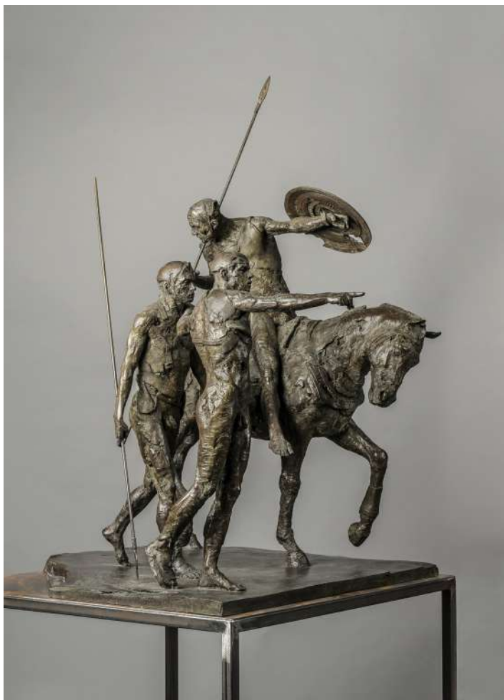
Christophe Charbonnel Groupe de guerriers plaque II, bronze (2010) Collection de l'artiste