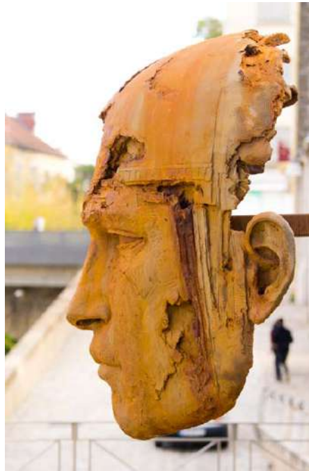
Tête de Persée monumentale Thésée et l'Amazone, du Torse au Belvédère, Bonnelles