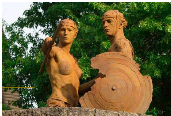
Thésée et l'Amazone Thésée et l'Amazone, du Torse au Belvédère, Bonnelles