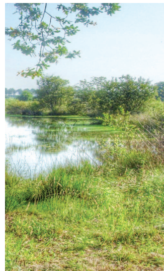
Photo: Vue de lagune à Ver (Landes)