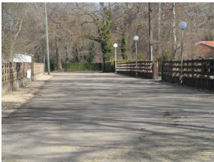
Rue Pat Kalley

de la rue Charles de Marcy le vendredi 22 janvier 2010, de la rue Pat Kalley, le mercredi 30 juin 2010.