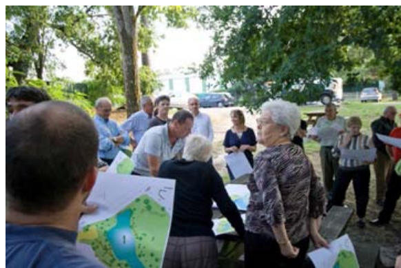
Aménagements présentés aux riverains