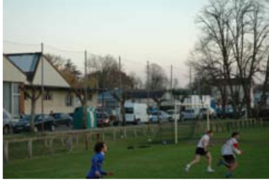
Stade du Pégé avant

Inauguration des aménagements de la rue Commandant Pardaillan : Samedi 6 février 2010