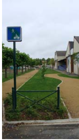
Stade du Pégé réaménagé