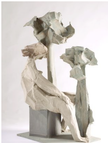
"Femme assise" (carton)