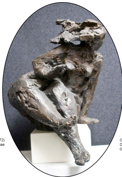
La jeune fille (1972) Bronze Susse