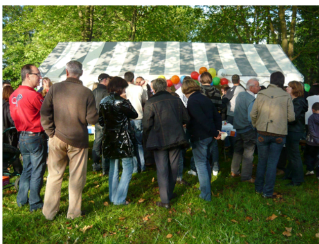
une centaine de personnes rassemblée pour cette manifestation