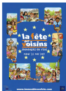
sur l'ensemble de l'îlot:

C'est pourquoi, dans le cadre de leurs missions, les Conseils de quartier ont souhaité s'associer à cette manifestation, qui se déroula pour la 1ère fois à Mont de Marsan le mardi 26 mai 2009.