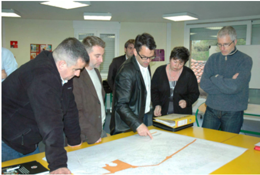
présentation du plan au conseil de quartier

Date d'inauguration : samedi 6 février à 14h (RDV devant le restaurant le Plumaçon)