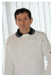
Président de novembre 2008 à juillet 2009